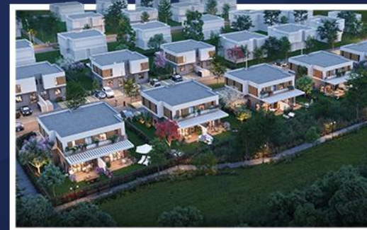
כפר יעבץ קרקע לבניית 20 יח"ד