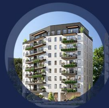
הורדים 8-10 גבעתיים