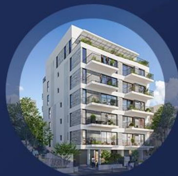
עמוס 31/33 תל אביב