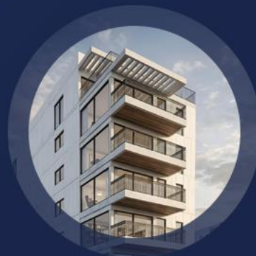
ל"ה 42 גבעתיים