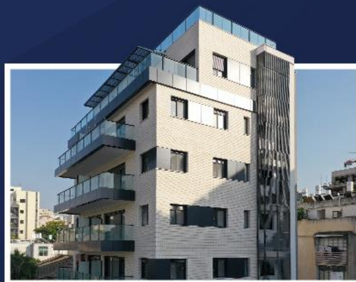
צהל 14 גבעתיים 12 יח"ד