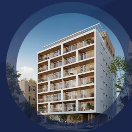
אורבוכ 26 רמת השרון