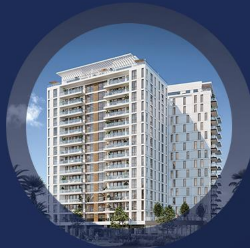
דב הוז 1-3 רחובות