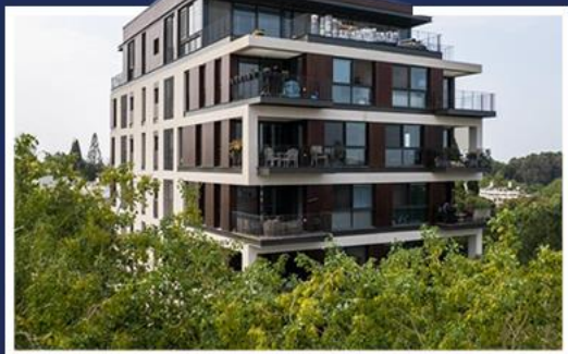
וויצמן 23 רמת השרון 21 יח"ד