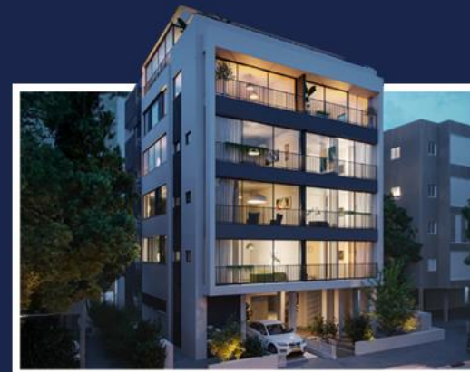
ריינס 45 תל אביב 11 יח"ד