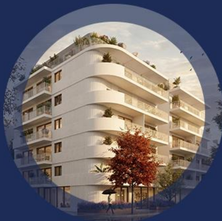
ברדיצ'בסקי 14-16 גבעתיים