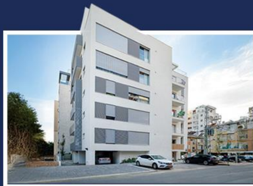
אבנר 1 רמת גן 11 יח"ד